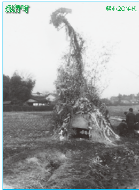
田んぼの中に自分たちで作ったどんど焼きの小屋に入って遊ぶ子どもたち。後方が銀行町