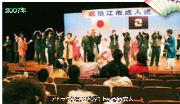
アトラクションで盛り上がる新成人