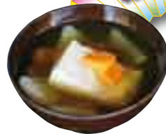
泉龍寺に残る文書を元に再現した安政4（1857）年の信者用の雑煮。実はダイコンとニンジンだけ

家では自分で作って、カマドや井戸など何力所にも飾りました。正月は親類が集まってお祝いするんです。子ども同士で遊んだけど、兄弟が10人以上という家も珍しくなくて、それはにぎやかでしたよ。3が日は働いてはいけないと言われていて、掃除もしませんでした。大みそかには「年越しそば」を食べたけど、実は家で打ったうどんでした。